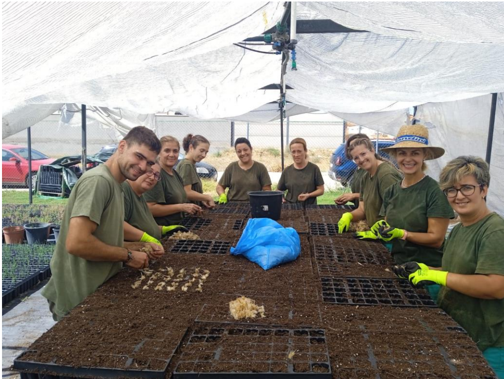
Figura 3. Grupo de voluntarias colaborando con el semillado de albardín en el vivero de la Fundación Global Nature.

de las plantas y como medida de optimización de recursos, para el ahorro de agua y electricidad cuenta con riego por goteo por sectores. Además, El vivero está certificado por Sohiscert como vivero ecológico. Las labores de semillado y mantenimiento de las plantas corren por cuenta de trabajadores de FGN que cuentan con apoyo de diferentes grupos de voluntarios, contando en este periodo con el apoyo de 15 voluntarios (Figura 13).