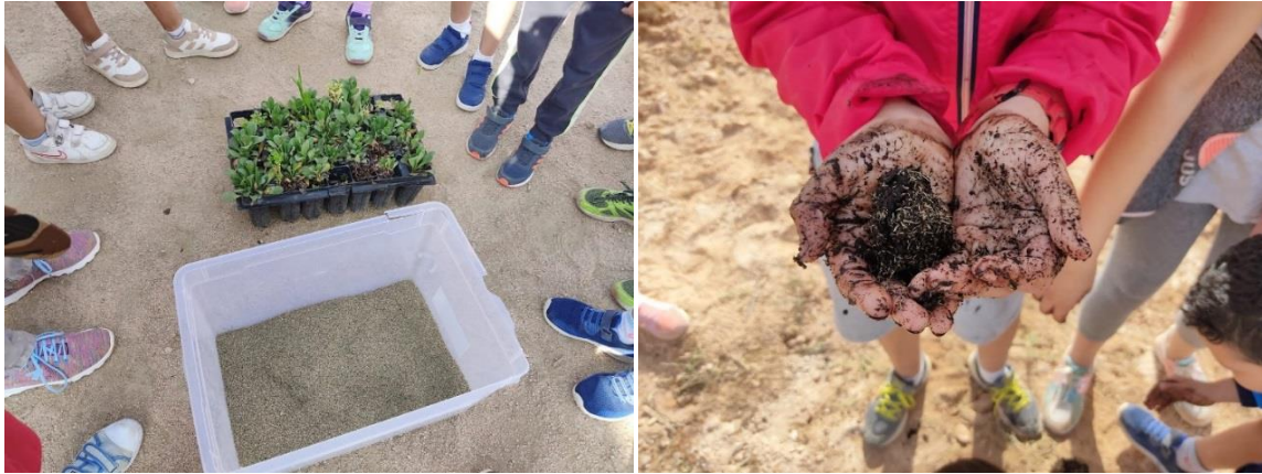
Figura 4. Jornada de plantación con Cruz Roja y escolares de la Villacañas y actividad “bolas de semilla”. En total 10 adultos y 35 niños participaron de la actividad.

Laguna de la Redondilla 150 plantas de limonio y 200 de albardín. Y con la actividad “bolas de semilla” (conocido también como Nendo Dango), se esparcieron un total de 1.000 semillas de limonio (Figura 4).