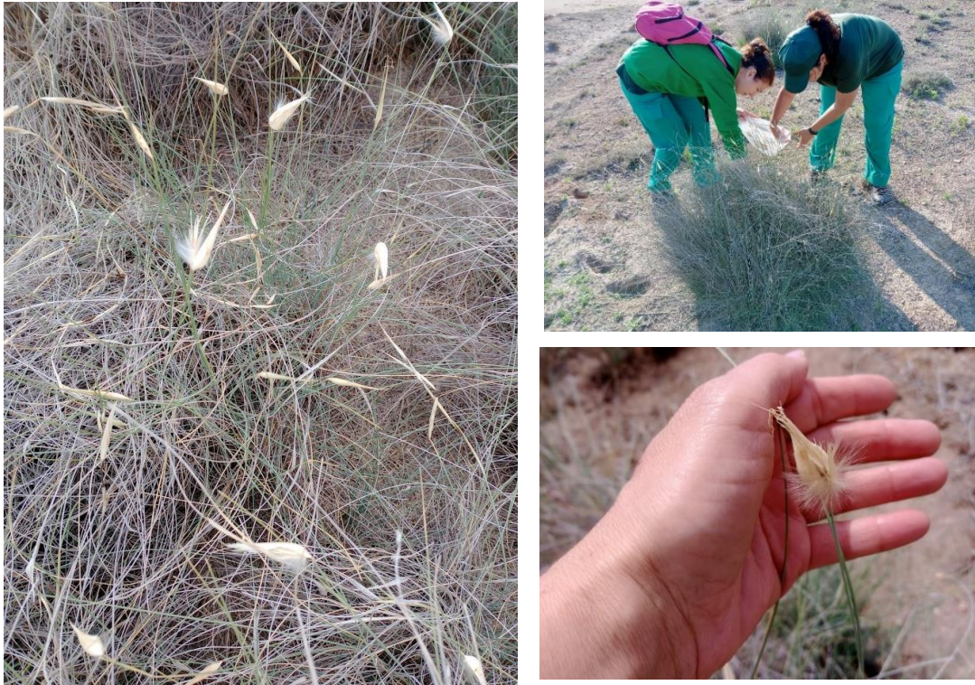
Figura 2. recogida de albardín a cargo de las participantes en el programa RECUAL de la Diputación de Toledo y el Ayuntamiento de Villacañas.

una acción formativa en alternancia con el empleo que facilita una mejor cualificación, profesionalización y reciclaje de sus beneficiarios, personas en situación de larga duración de desempleo.