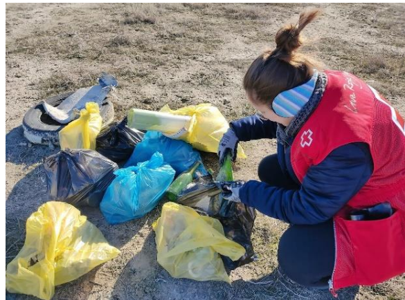
Figura 5. Recogida de residuos y su separación para el correcto reciclaje.