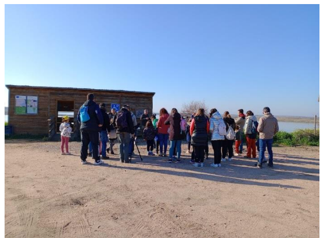
Figura 6. Ruta de senderismo e identificación de aves. La ruta incluyó la parcela en custodia de FUNDEM.