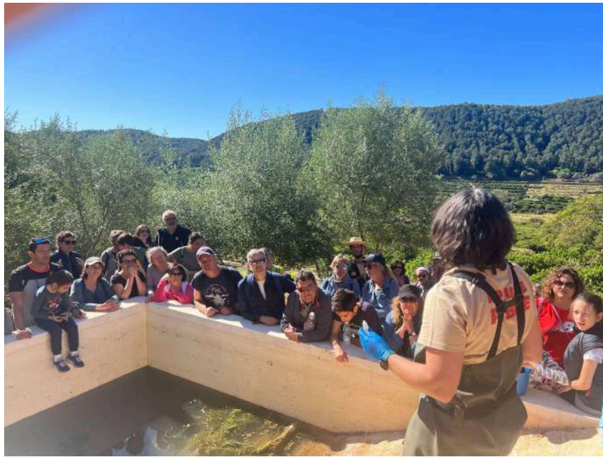
Extracció dels ofegabous i plantes aquàtiques per a procedir a la reparació de la bassa.