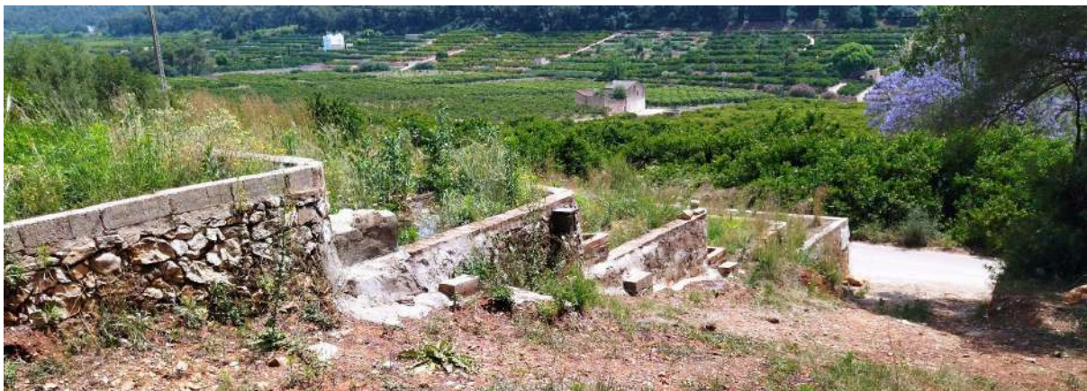
Ampliació de les reparacions del sistema de reg amb presència de fauna reptiliana.