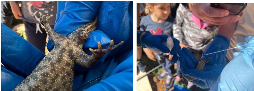
Taller amb famílies i docents